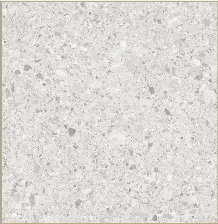
CÉRAMIQUE 24 X 24