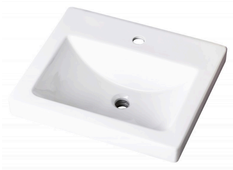
LAVABO SUR PLAN