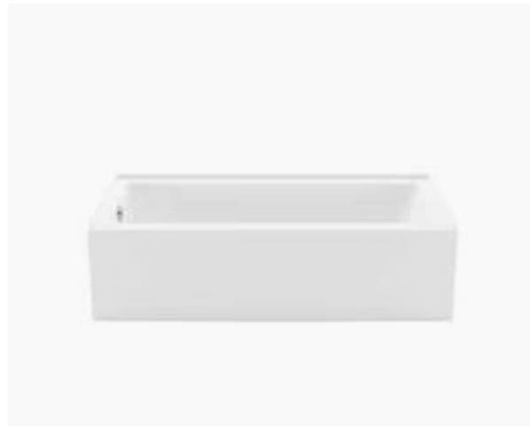
BAIN EN ALCÔVE