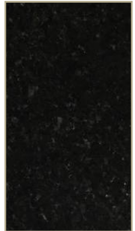
STRATIFIER DE COULEUR PIERRE NOIR