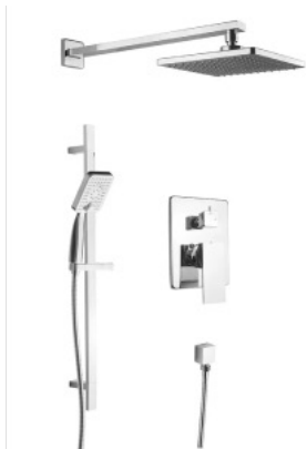
ROBINET DE DOUCHE ET BAIN DOUCHE