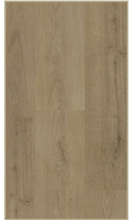
PLANCHER DE VINYLE COLLÉ

*Modèle de céramique à titre représentatif, sujet à changement selon les disponibilités*