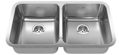
ÉVIER SOUS PLAN