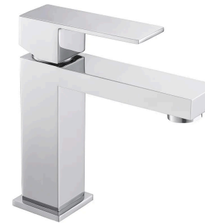
ROBINET D'ÉVIER SALLE DE BAIN