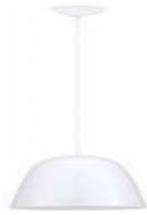
SUSPENDU SALLE À MANGER

*Luminaire à titre représentatif, sujet à changement selon les disponibilités *