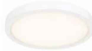
PLAFONNIER DES CHAMBRES